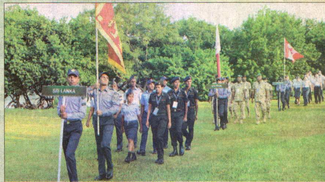
ගොල්ල තරඟාවලියේ සමාරම්භක අවස්ථාව

තරඟාවලියේ සමාරම්භක අවස්ථාවට යුද හමුදාපති ලුතිනන් ජනරාල් මහේෂ් සේනානායක, ගුවන් හමුදා මෙහෙයුම් අධ්‍යක්ෂ ජනරාල් වයිස් මාර්ෂල් එස්. කේ. පතිරණ යන මහත්වරුන් ඇතුළු විදෙස් හමුදා නිලධාරීන් රැසක් ද එක්ව සිටියහ.