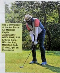
The Commander of the Air Force Air Marshal Kapila Jayasinghe WWW, RWP, RSP & three Bars, MSC (Int. Rel), MM (SL), Indu (China), OII on the course