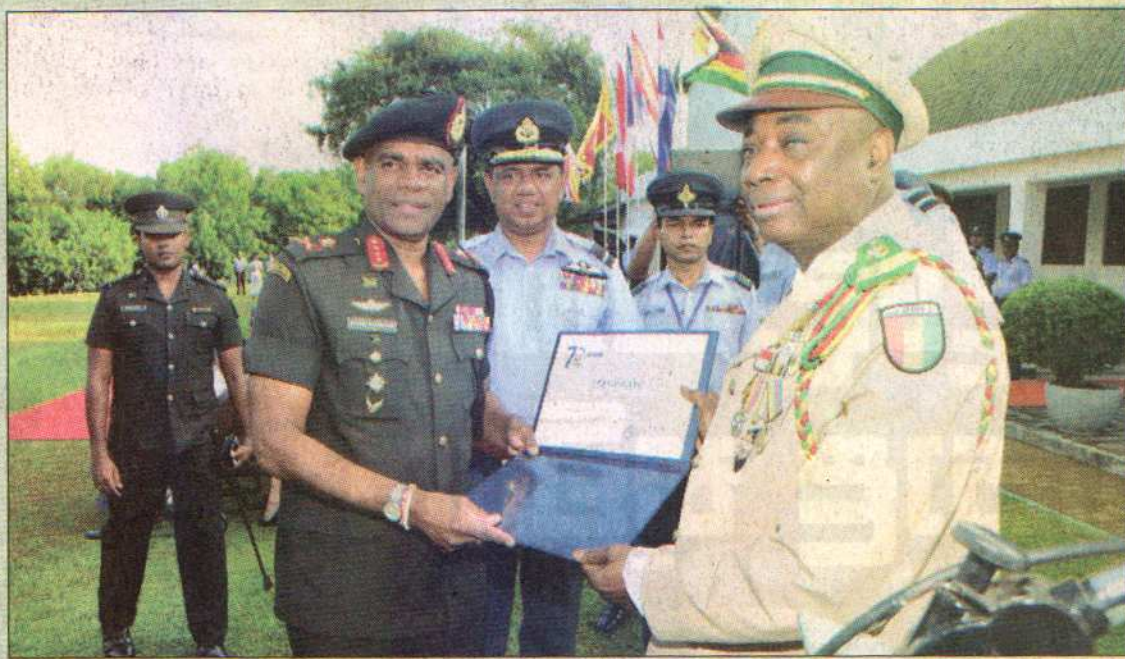
යුධ හමුදාපති වරයාට නිල ලාංඡනයේ ජයග්‍රාහී සහතිකය පිරිනමමින්

1948 වසරේදී රටවල් පහක සහභාගිත්වයෙන් ඇරඹී දෙවන ලෝක ආරක්‍ෂක සේවා කවුන්සිලය තුළ මේ වනවිට රටවල් 136 ක් සාමාජිකත්වය දරනු ලබයි. ශ්‍රී ලංකාව 1974 වසරේදී මෙම ආරක්‍ෂක සේවා කවුන්සිලයේ සාමාජිකත්වය හිමිකර ගෙන තිබේ.