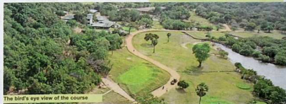
The bird's eye view of the course